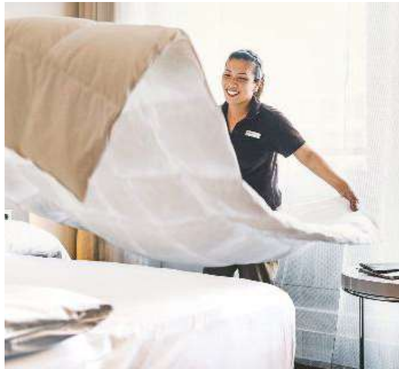
Zu den Kunden von Kleine zählen auch Hotels in Berlin und Brandenburg.

Reimund Lepiorz markus.targiel@holzmann-medien.de